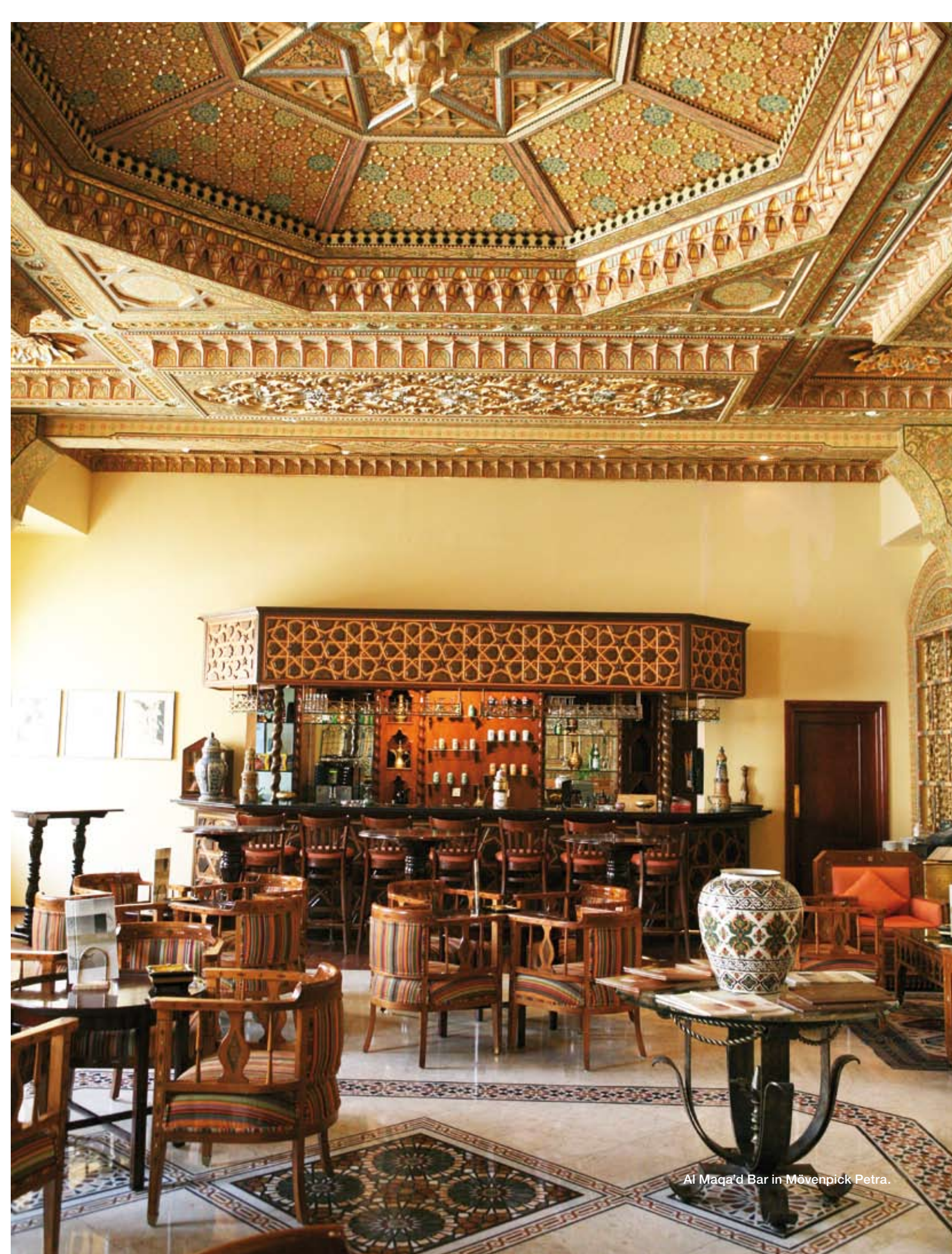
Al Maqa'd Bar in Mövenpick Petra.