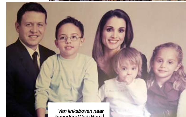
Van linksboven naar beneden: Wadi Rum | Boetiek in Mövenpick Petra | Foto (van foto) van de koninklijke familie: Abdullah, Rania en hun drie kinderen | Petra.

Vroeg in de ochtend klinkt handgeklap: een wake-up call van onze sjeik. De zonsopkomst boven de woestijn is een fenomeen om niet te missen. We beklimmen een zandheuvel vlak- ▶