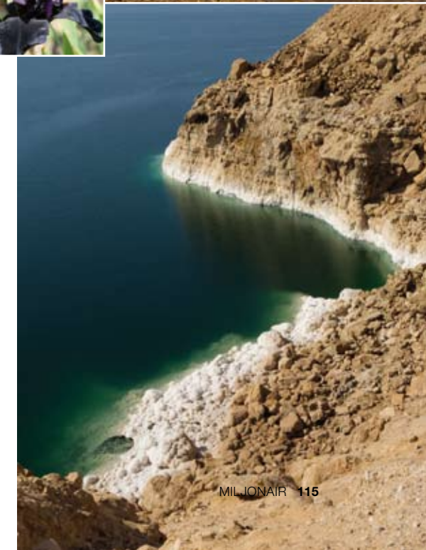
Van boven naar beneden: Bord in de Jordaanvallei | Zwembad van Jordan Valley Marriott Resort & Spa | Hotelgaste smeert zich in met Dode Zeemodder | Zoutkristallen langs de oevers van de Dode Zee | De zwarte iris, het symbool van Jordanië.