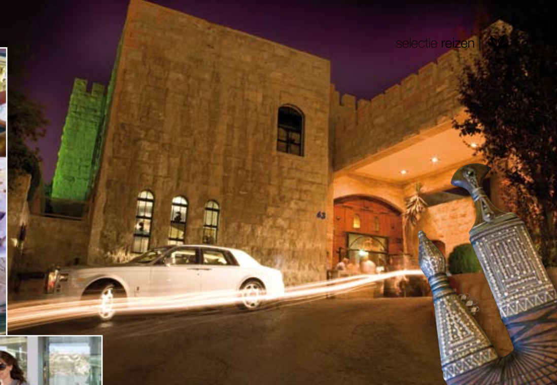
Links: Abdoun Bridge. Rechts, met de klok mee: De mezze in Reem Al Bawadi | Rolls-Royce Phantom voor het fortachtige restaurant | Bugatti in The Royal Automobile Museum | Villa in Amman | Winkelen in Abdoun Mall in Amman | Vaas in een antiekzaak.