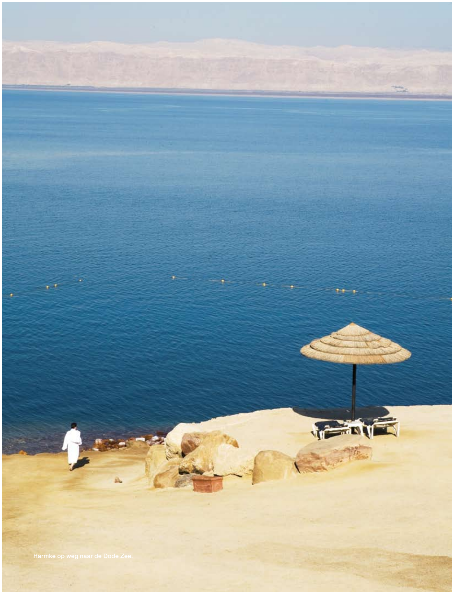
Harmke op weg naar de Dode Zee.