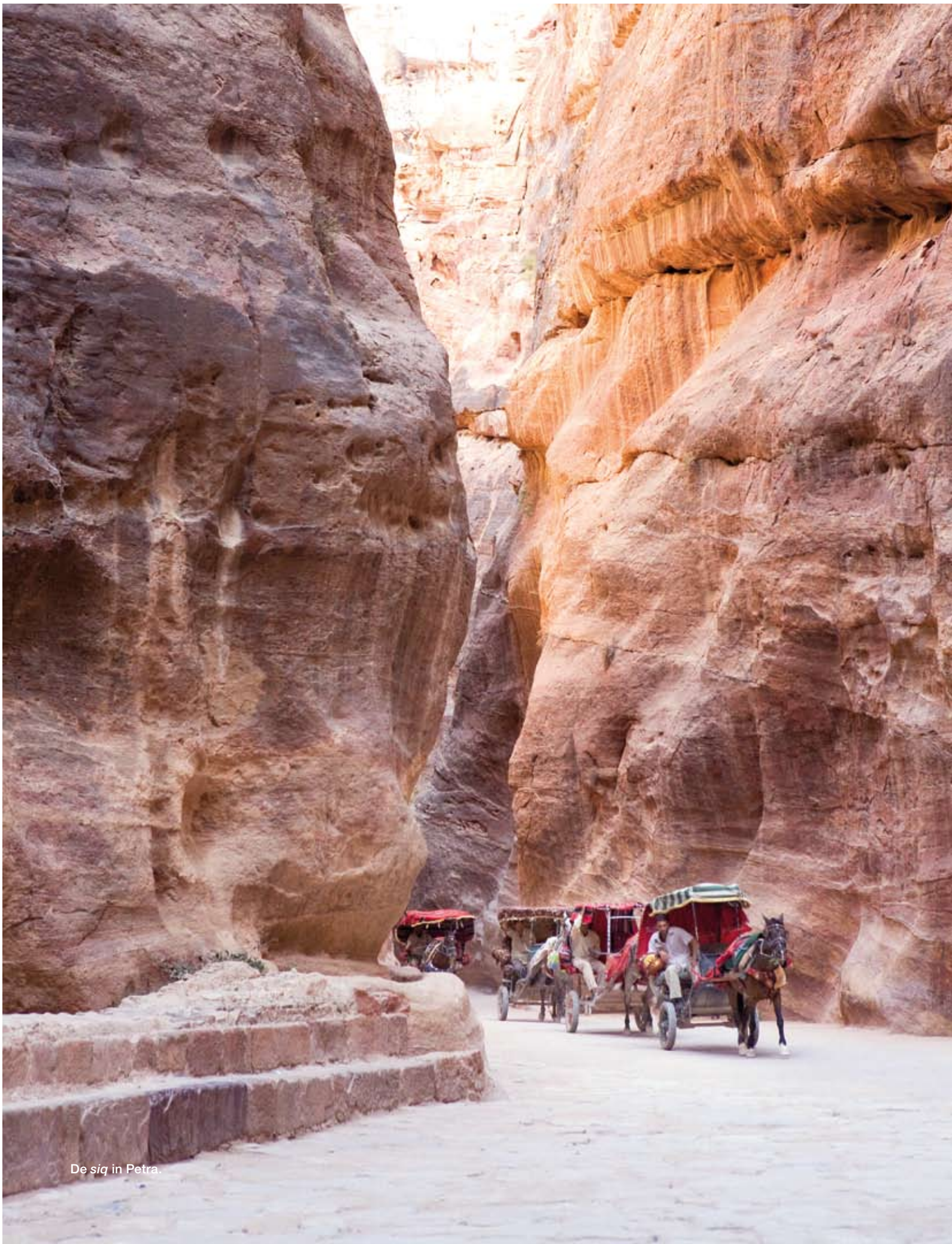
De siq in Petra.